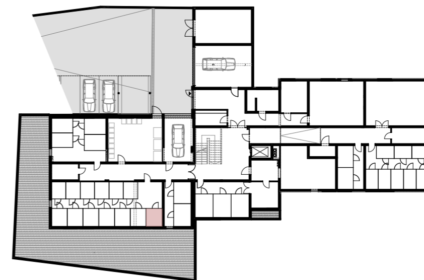
ÜBERSICHTSPLAN KELLER M 1:500