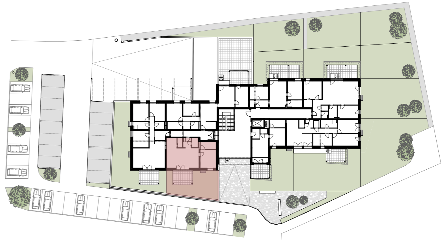
ÜBERSICHTSPLAN ERDGESCHOSS M 1:500